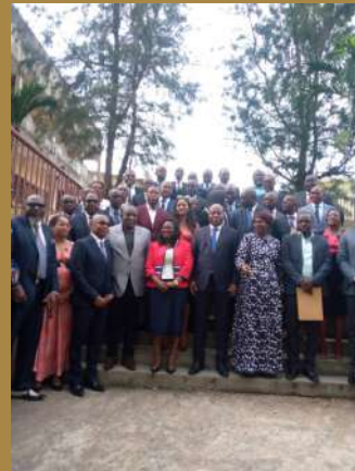
Photo 6: Photo de famille autour du Ministre de l'Enseignement Supérieur.