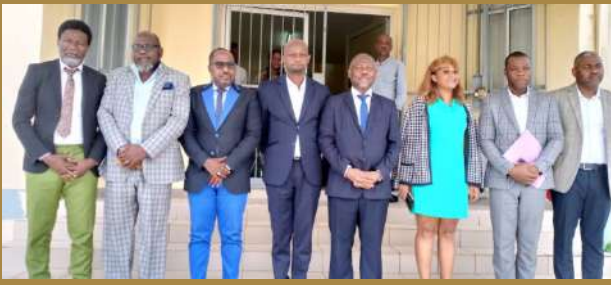
Photo 1: Photo de famille autour du Commissaire Général (CG) du CENAREST.