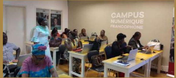
Photos 2 à 6: Les participants à la formation (IRSH-CENAREST et l'IUSO)